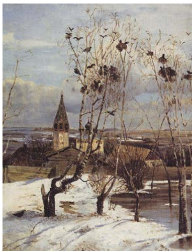
А. Саврасов «Грачи прилетели»