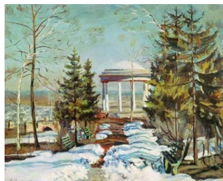
Жуковский С. Ю. «Ранняя весна»