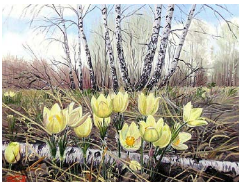
Д. Репин «Первоцветы»

Дети: прилетели птицы из теплых стран, тает снег, расцвели первые цветы.