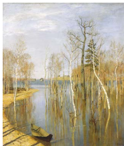
И. Левитан «Большая вода»